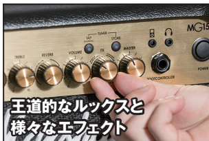
王道的なルックスと様々なエフェクト

ソリッド・ステートならではの現代的なマーシャル・サウンドが与えられているMG15FX。繊細なクリーン・トーンからウルトラ・ハイ・ゲイン・サウンドまで自在に引き出せる4チャンネル仕様や、6種類のデジタル・エフェクトの搭載、外部音源が鳴らせるAUX INの装備など、機能性の高さは群を抜いている。クオリティーの高いプリセット音色が各チャンネルに用意されていることも魅力。