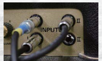
↑4インプット仕様なので、このようにリンクという裏ワザを使うことも可能だ