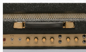
↑1958X、1973Xともにコントロール関係は共通だ