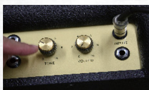
↑1958Xは、2チャンネルあるが、1EQと1ボリュームで音を作り出す

〈仕様〉 ●出力: 18w ●真空管: プリ管=ECC83×2、パワー管=ECC83×1+EL84×2 ●コントロール: トーン、ボリューム×2、スピード、インテンシティ、トレモロ ●入出力端子: インプット2×2 ●スピーカー: セレクション製(G10G-15) 10インチ×2 ●外形寸法: 610(幅)×535(高さ)×230(奥行き) mm ●重量: 19.5kg