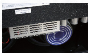
↑スピーカーは、セレクション製のブルーバック。手前に見えるのが真空管だ

最後に試奏したのは、1965年に登場し、マーシャル・アンプの中でも伝説のコンボ・モデル“ブルースプレーカー”を再現した1962HWだ。65年当時、エリック・クラプトンによる革命的なサウンドもあり、その後のエレクトリック・ギター・シーンにオーバードライブ・サウンドを定着させるキッカケとなったアンプで、当時のトランスを製造していた会社からのトランス供給など、細部にわたりハンドワイヤードで忠実に再現している。グリーン・バック12インチ・スピーカーを2基マウントした出力30wコンボで、アンプ部の仕様は、2245THWと同様。CH1のハイにインプットし音量を上げると、低ボリュームから自然なクラッチが始まり、フル・アップではエネルギーでタイトなオーバードライブまで、どのボリューム位置でも輪郭のしっかりとした明快なトーンを作り出してくれる。ドライブ・サウンド時でも、ピッキングやフィンガリングの微妙なニュ