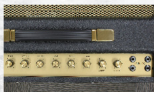
↑1962HWのコントロール類は、2245THWと共通している