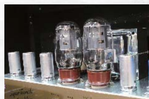
↑2245THWは、プリ管にECC83、パワー管にKT66とECC83という真空管を採用

そして、グリーンバック12インチ・スピーカーを2基マウントしたモデルが1973Xだ。1973Xオリジナルは、1966年から68年の間に発売されたコンボ。こちらは出力18wで、スピーカー以外のアンプ部の仕様、パーツは1958Xと同じだが、スピーカーが大きくくなっているぶん1958Xに比べると本体サイズも横幅が約10cmほど大きくなっている。さて、サウンドのほうだ